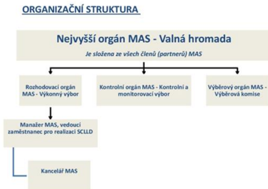
Obrázek 3 Organizační struktura MAS SVATOVÁCLAVSKO, z.s.

Složení orgánů je zveřejněno na http://www.svatovaclavsko.cz/cz/organy-spolku . Kontakty na pracovníky MAS jsou uvedeny na http://www.svatovaclavsko.cz/cz/kontakt .